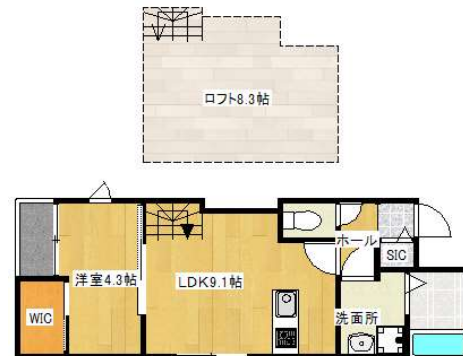
タイプIロフト付き