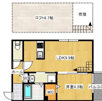
タイプIIIロフト付き