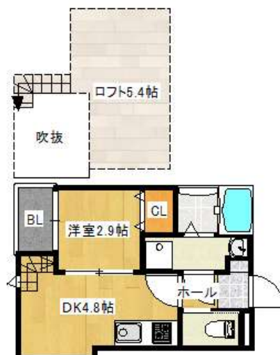
タイプIIロフト付き