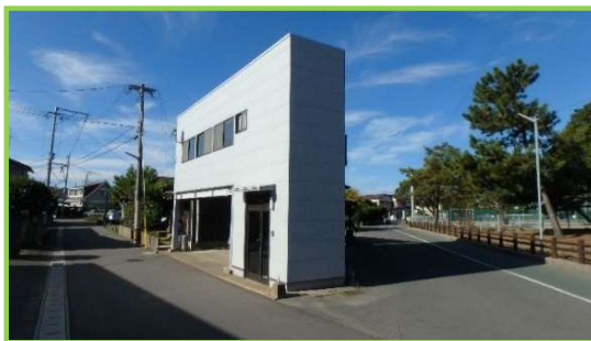
広々とした前面道路