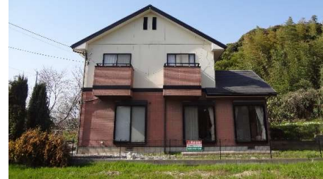
現在、写真手前敷地に建物が建築してあります。