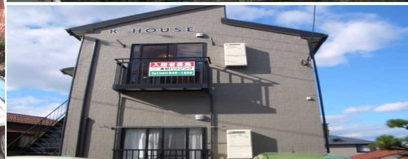
※方位及び間取図については、略図につき現況優先となります。