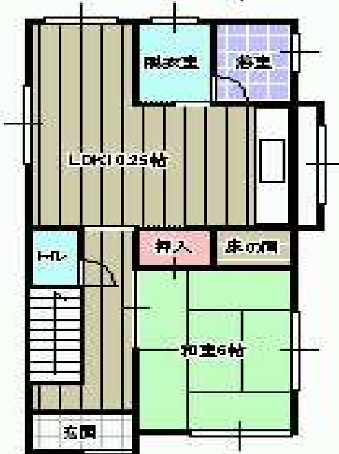
1号棟タイプ。(2号棟は反転タイプとなります)