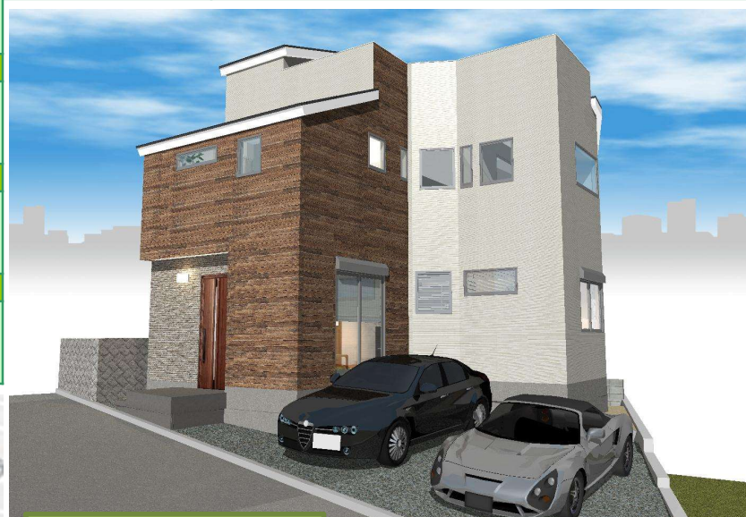
外構はイメージです。

見晴らしの良さが自慢の屋上スペースを確保 自然光をふんだんに取り込める吹き抜け構造