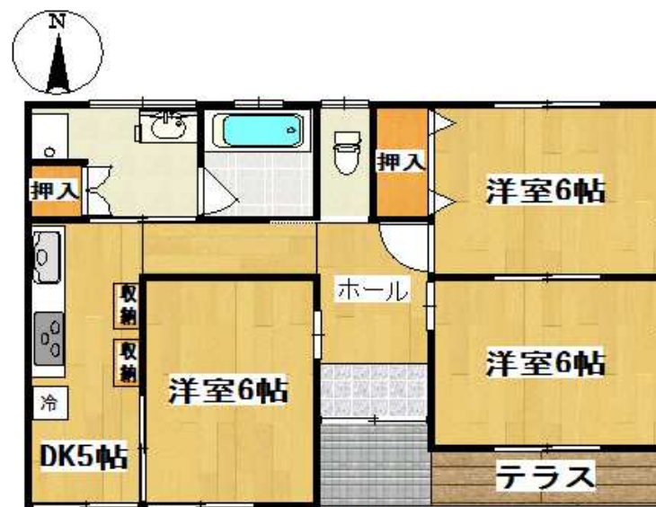
図面と現状が異なる場合、現状を優先いたします。