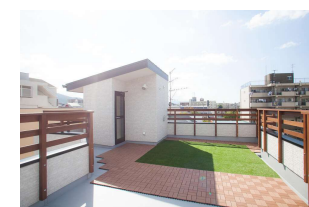
イメージ写真です 実際とは異なります