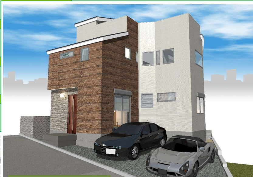
外構はイメージです。

見晴らしの良さが自慢の屋上スペースを確保 自然光をふんだんに取り込める吹き抜け構造