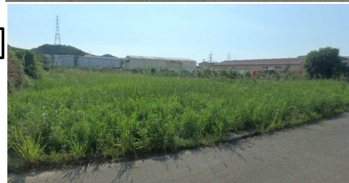
*写真は、令和2年8月現在のものです。