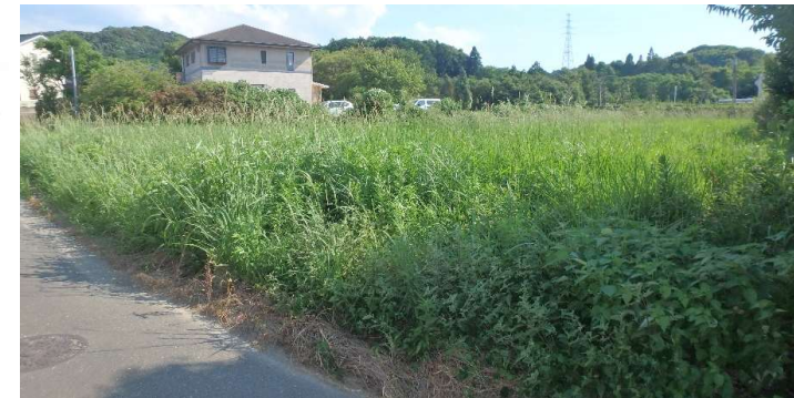
※方位及び図面については、略図につき現況優先となります。